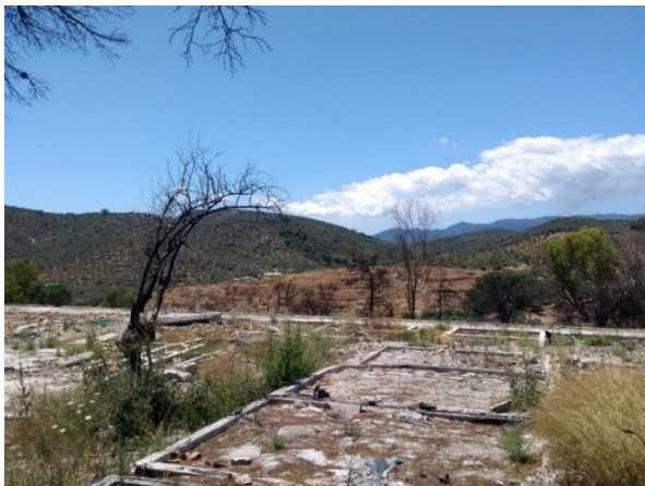
[Foto 10: Moria Camp, die Grundmauern des ehemaligen Abschiebefängnis?]

Anke, unsere Fotografin ist zurückgeblieben; die Gruppe hat sich schon über das Gelände verteilt, was Jakob nicht gefällt, er ist angespannt. Im inneren Teil, der noch immer mit Stacheldraht und hohen Betonmauern befestigt ist, steht ein Mann in Uniform, als er uns sieht, dreht er sich um und verschwindet. Es gibt scheinbar noch verwertbare Dinge im Inneren des Gebäudes, jedenfalls wird es vom Militär bewacht. Der Gebäudekomplex ist groß, als wir auf einer abzweigenden Straße am Hauptportal vorbeigehen, sieht man links noch die Grundmauern von gleichartigen einzelnen Räumen, das könnte das Abschiebefängnis mit seinen Zellen gewesen sein.