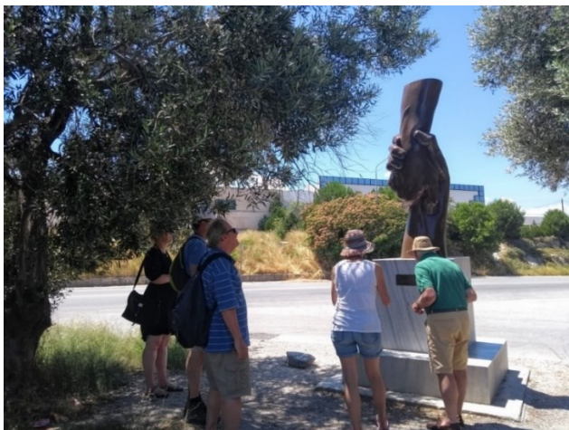
[Foto 12: Unsere Gruppe an der Skulptur am Eingang von Kara Tepe 1]

Auch dieses Camp wurde im November 2020 geräumt. Viele der ca. 1.000 Bewohner wurden wahrscheinlich aufs Festland gebracht, aber Genaues weiß man nicht. Wir parken auf dem Parkplatz des zwischen dem neuen und alten Lager gelegenen Lidl und gehen des Rest des Weges zu Fuß. Die Gegend ist eine Art Industriegebiet, gelegen an der Hauptzufahrtsstraße nach Mytilini. In den kleinen Zufahrtswegen zu den verschiedenen Grundstücken stehen Polizeibusse und -autos, vor allem in der Nähe des neuen Camps, aber auch weiter oberhalb. Hinter den Zäunen des ehemaligen Camps sieht man Container. Ansonsten ist nichts zu erkennen, an der Straße wachsen hohe Oleander und Büsche, durch die man nichts erkennen kann. Wir erreichen die Hügelkuppe, dort steht eine Skulptur eines „Rettungsgriffs“, eine von oben kommende Hand, die eine von unten kommende umfasst. Dort ist die Einfahrt zu Kara Tepe 1.