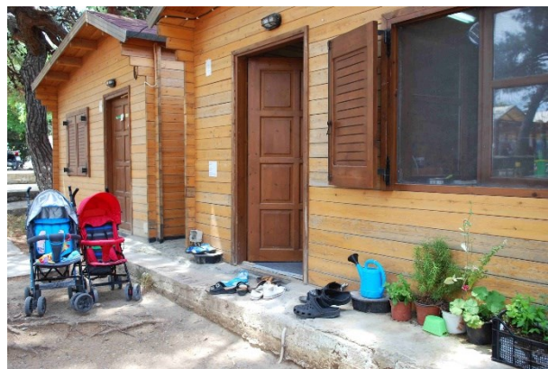
[Foto 25, 26: Häuser in Pipka 2018]